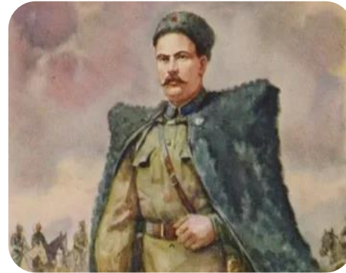
БЛАГОДАРНАЯ ПАМЯТЬ ПОТОМКОВ

Установление советской власти в Луганске. В 1917 году он стал начальником штаба Красной гвардии Луганска. В 1918 году формировал отряды и участвовал в боях против германских оккупационных войск и казаков атамана Каледина.