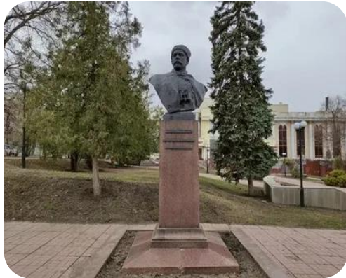
РОЛЬ В СУДЬБЕ РЕГИОНА И СТРАНЫ

Легендарный герой Гражданской войны родился в селе Макаров Яр на Луганщине. Он был простым рабочим-слесарем, а когда началась война, встал на защиту своей земли и своих идеалов.