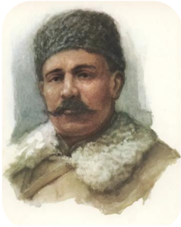
Александр Яковлевич Пархоменко

Легендарный герой Гражданской войны родился в селе Макаров Яр на Луганщине. Он был простым рабочим-слесарем, а когда началась война, встал на защиту своей земли и своих идеалов.