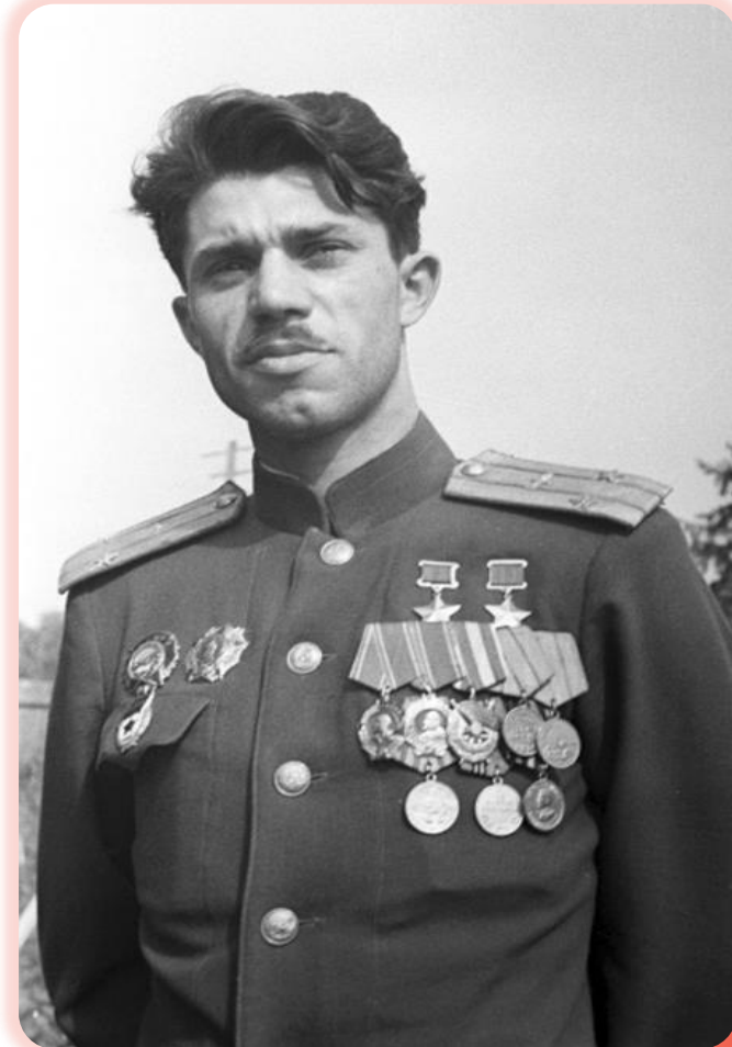
Молодчий Александр Игнатьевич

Окончил военную школу пилотов и к началу войны, в 21 год, уже был опытным командиром. 311 боевых вылетов, 287 — в темное время суток. Первая «Золотая Звезда» в 1941 году, через 4 месяца после начала войны. Вторая «Золотая Звезда» в 1942 году за 145 боевых вылетов.